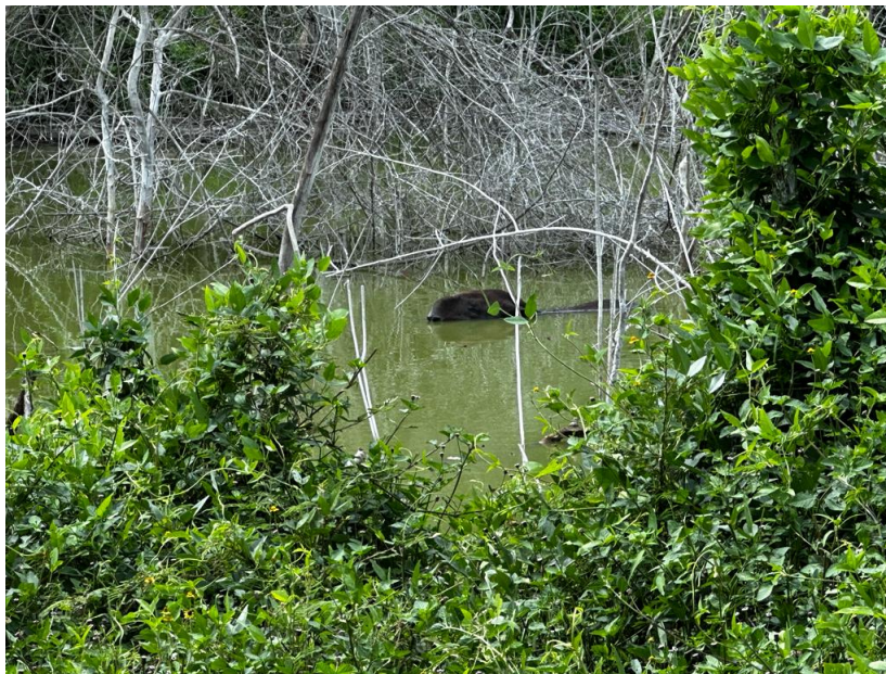
Aguada fuente de hidratación para el Tapir del Km 17, Silvitic Campeche.