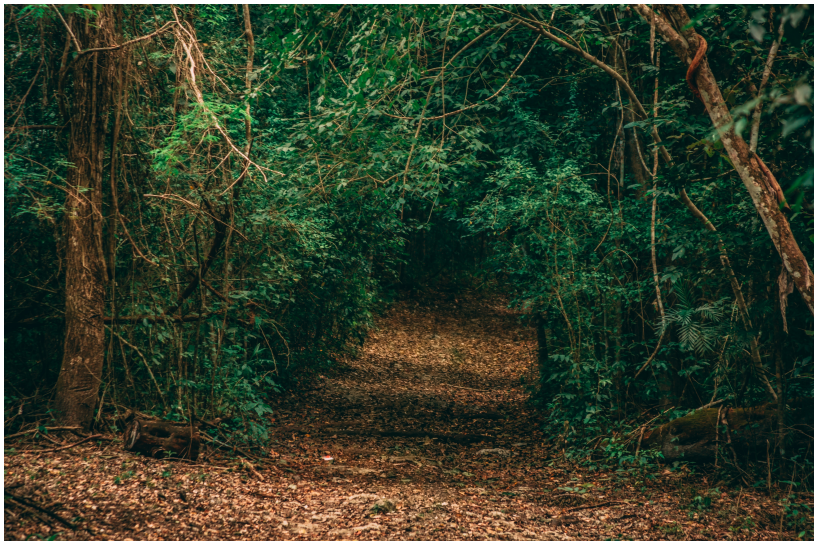
Reserva de Balam Kin y Balam Ku, Campeche.